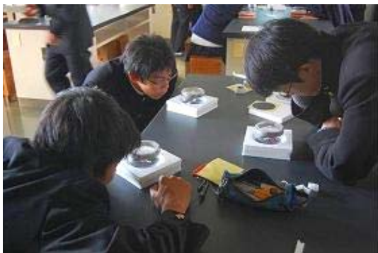
【工作教室のイメージ】

千葉県柏市柏の葉地区は、東京大学や千葉大学をはじめとする数多くの高度学術機関を有する地域特性を活かし、この街を世界に誇る「国際キャンパスタウン」としていくために、公民学共同での新しい街づくりが進められています。今回のサイエンスカフェについても、学術機関の研究者と市民とが交流することで、当地域の国際キャンパスタウン構想推進に貢献する取り組みとして、今後も継続的な実施を検討してまいります。