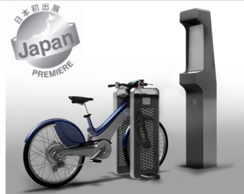
日本初公開となるハイブリッドバイク 「POWERIDE "Touring"」