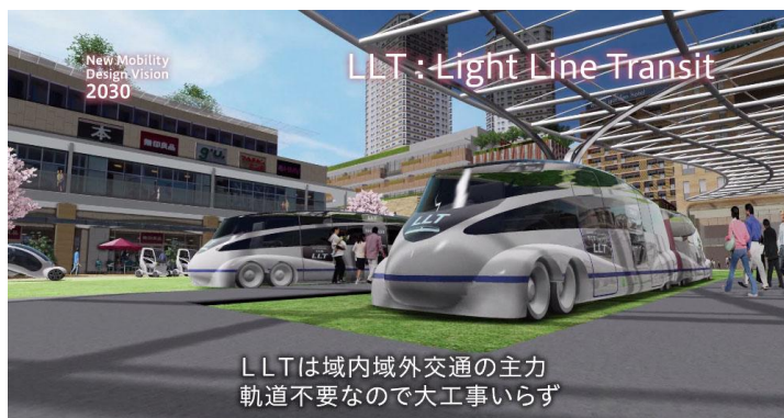
ecomo ブースで上映されるCGムービー

*プレスプレゼンテーションは当ブースにて 12月1日 15:30～16:00 に開催します