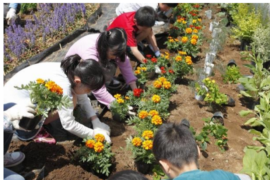
柏の葉小学校でのイベント風景

住友化学グループは CSR 活動として地域の環境美化活動を推進しており、その一環でかしはなプロジェクトをサポートします。かしはなカフェに先駆け、4月26日には柏市立柏の葉小学校にて、ガーデニングを通じて植物や生命について学ぶ“花育”イベントを実施し、児童約70名と父兄や環境サポーター約10名が参加し花壇づくりを行いました。今後はかしはなカフェを通じて、小学生やその家族にも積極参加を呼び掛けながら、地域の緑化・環境美化に向けて活動を広げるとともに、園芸を通じた地域の環境問題への意識高揚をめざします。