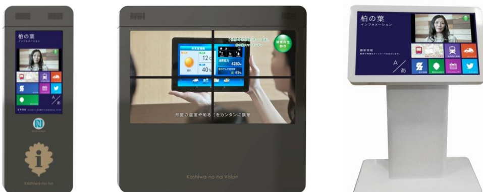
目的と設置環境にあわせた3種類のデジタルサイネージを計4台設置

※4 NFC（Near Field Communication）は、10cm程度の距離から通信機器を「かざす」ことでデータ通信が可能になる技術です。