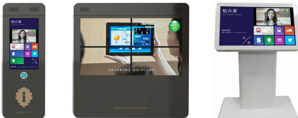
目的と設置環境にあわせた3種類のデジタルサイネージを計4台設置

※4 NFC（Near Field Communication）は、10cm程度の距離から通信機器を「かざす」ことでデータ通信が可能になる技術です。