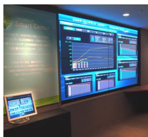
スマートセンター