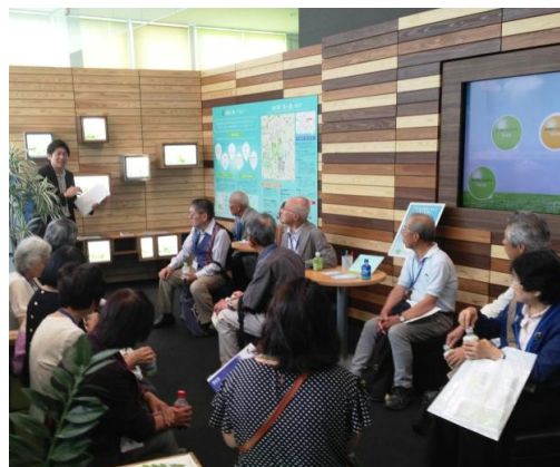
館内ガイドのイメージ