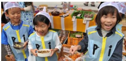
※写真はピノキオプロジェクト2009の開催風景