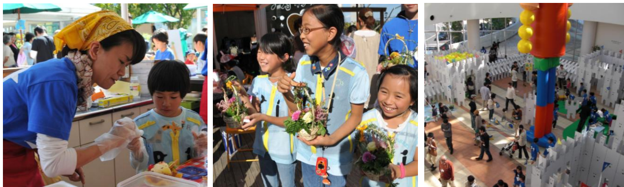
※写真はすべてピノキオプロジェクト 2009 の開催風景