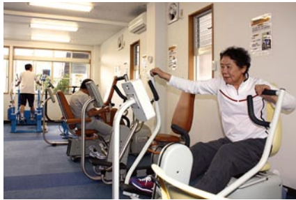
一般的なジムでは見かけない、ユニークなトレーニングマシンが並ぶ。(十坪ジムグランデ新柏)

十坪ジムと商店街は相性がよく、空き店舗の活用による商店街の活性化も狙いのひとつです。空き店舗の多くは、10～15坪程度で、十坪ジムの運営に最適。トレーナーを地域の住民が担うことで雇用促進にもなり、地域経済の振興に役立つと期待されています。