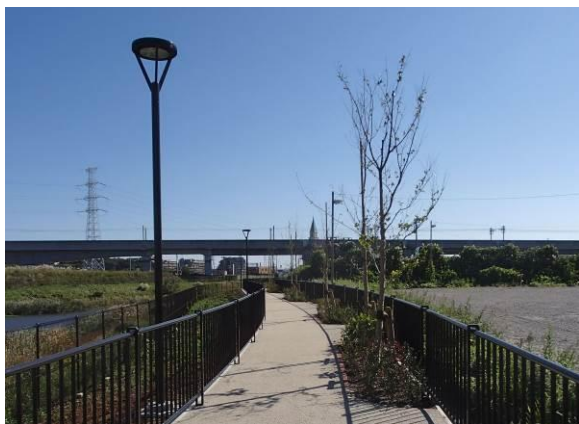
〈2号調整池遊歩道〉 自然な風合いの透水性舗装と遊歩道からの景観を確保する柵の配置

■1号近隣公園は、こんぶくろ池公園(18.5ha)の一部で公園の南東部に位置するエリアです。同公園は2015年以降に柏市が整備する予定ですが、民間主導により先行してその一部(約0.5ha)を暫定整備し、2014年4月に暫定開放します。現在、NPO法人こんぶくろ池自然の森と柏の葉キャンパス駅前まちづくり協議会が協力し、市民とともに公園を整備する「公園サポートプロジェクト」が進行中です。11月16日の芝張りイベントはプロジェクトの一環として実施し、その後も公園のサインやイス等の製作・設置を計画しています。