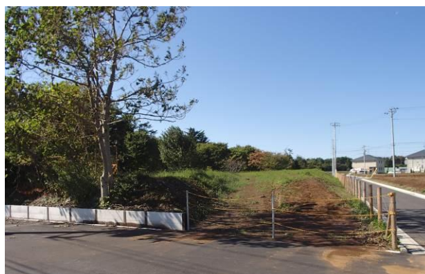
1号近隣公園(芝生広場)の現況

MAIL: info@konbukuroike.com FAX: 04-7132-8800